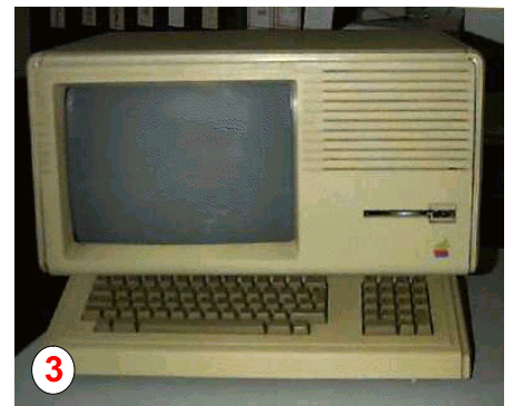
Bild 3, Bild 4: